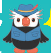
北方領土「エリオくん」