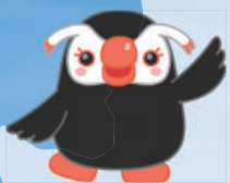
北方領土「エリカちゃん」