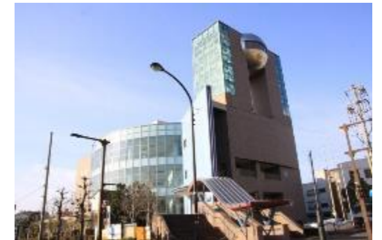
アクアトム（敦賀市）