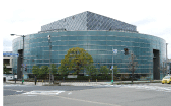
福井県国際交流会館