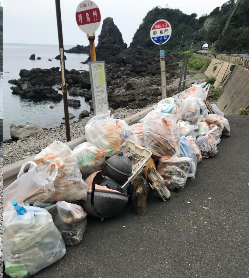
越前海岸「呼鳥門」清掃活動 令和4年6月11日(土)