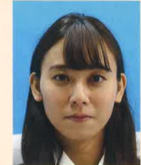
背景に異物が写りこんでいるもの