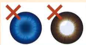
意図的にフラッシュやライトの形状が写り込んだもの