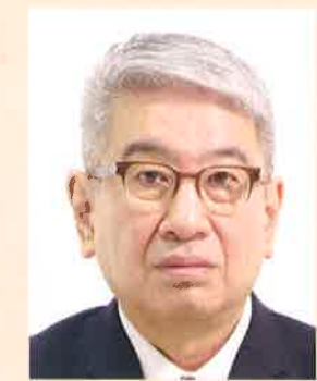
頭、髪、服装等と背景の境界が不明瞭なもの