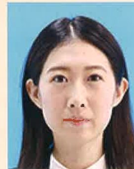
ジャギー(階段状のギザギザ模様)があるもの