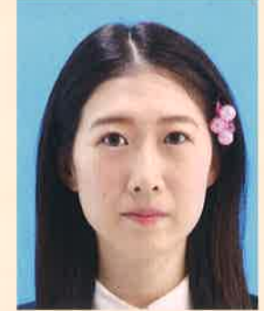
装飾品で目・耳・鼻・唇などが隠れているもの