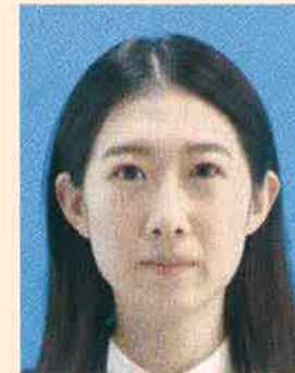
ドット(網状の点)やインクのにじみがあるもの