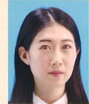
横を向いているもの