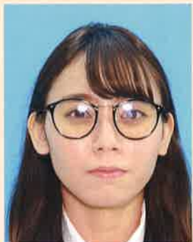
照明が眼鏡に反射したもの