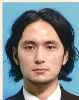
てかりやムラがあるもの