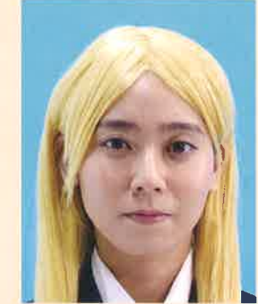
カツラ(ウィッグ)などにより実際の容姿や雰囲気が変わるもの