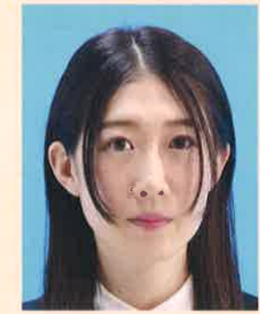
髪が目にかかっているもの