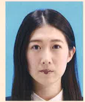
顔の輪郭が隠れるもの