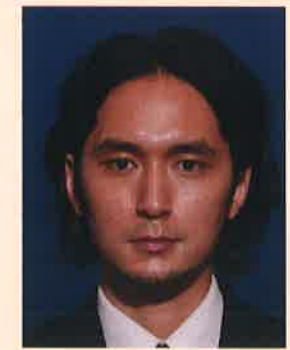
背景の色が濃いもの