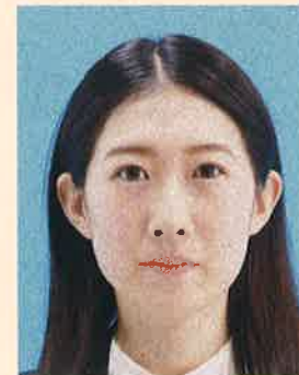
ノイズ(画像の乱れ)があるもの

デジタル画像の過剰な圧縮などが原因となってノイズ(画像の乱れ)が発生しているものや、ジャギー(階段状のギザギザ模様)、印刷時のドット(網状の点)やインクのにじみがあるものは不適当です。写真専用の用紙を使用し、鮮明な画質で印刷してください。