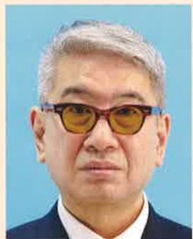
色付きの眼鏡やサングラス

より確実な本人確認のため、眼鏡を外した顔写真を推奨します。眼鏡を着用するとき、色付きのレンズや反射・影があるものは不適当です。また、目を妨げる縁・フレームがないものに限りです。医療上必要とされない限り、サングラスや処方のない色付きの眼鏡は不適当です。