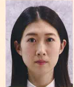
背景が柄模様であったり、凹凸のあるクロスが写りこんでいるもの