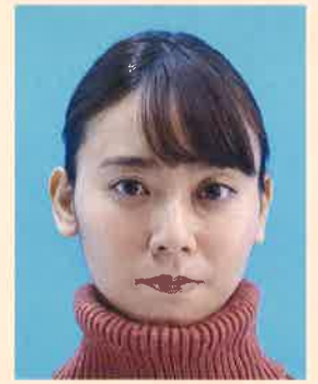
タートルネック、パーカーのフード、首を覆うもの、衣服などにより顎などの顔の一部が隠れているもの