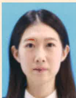
ピンぼけや手ぶれにより不鮮明なもの

撮影時にピントが合っていないかったり、手ぶれしてしまったため不鮮明なものや、顔にてかりやムラがあるものは不適当です。