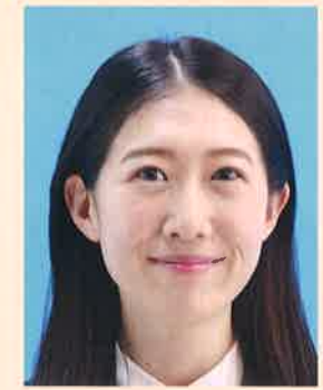
口角が上がるなどにより実際の容姿と著しく異なるもの