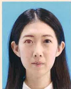
変形やマスクングなどの画像処理をほどこしたもの