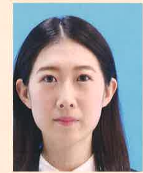
位置が片寄っているもの