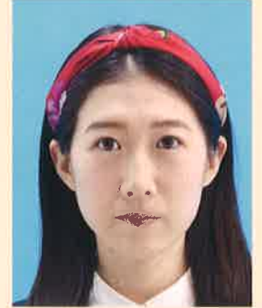
帽子やヘアバンドなどにより頭部が隠れているもの