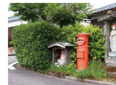
写真の応募はこちら!

10月12日(月・祝)まで 昭和期に作られた建造物や昭和に活躍した人物の銅像、昭和を感じさせる風景など、今も街かどで見ることができる”昭和の面影”を写した写真を募集し、展示します。