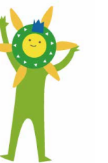
こども歴史文化館キャラクター-これきちゃん

7月18日(土)～8月30日(日) リアルなミニチュアから、刀の鑢やポトルシップなどのふくいゆかりの工芸品まで、小さな品々に込められたこだわりや魅力を紹介します。