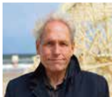
テオ・ヤンセン / アーティスト

1948年、オランダ、スフェニンゲンに生まれる。デルフト工科大学にて物理学を専攻後、画家に転向。1986年から新聞のコラムを執筆し、その中の「砂浜の放浪者」をきっかけに「ストランドビースト」を考え出す。「現代のレオナルド・ダ・ヴィンチ」と称され、芸術と科学の融合した作品を発信し続けている。