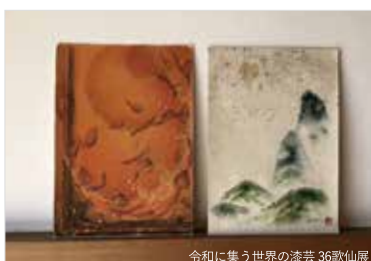
令和に集う世界の漆芸 36歌仙展