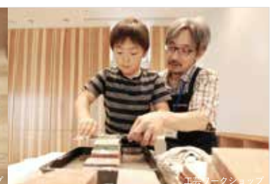
工芸ワークショップ