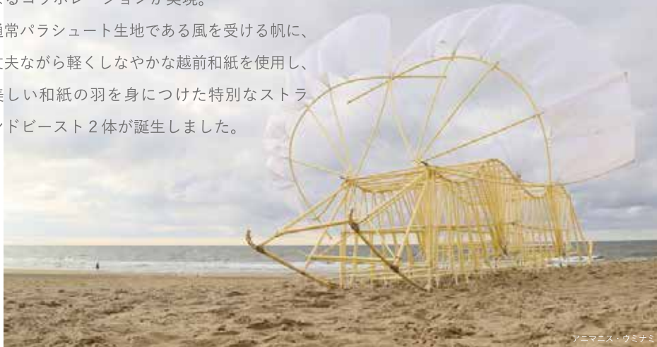
アニメニス・ウミナミ

通常パラシュート生地である風を受ける帆に、丈夫ながら軽しなやかな越前和紙を使用し、美しい和紙の羽を身につけた特別なストランドビースト2体が誕生しました。