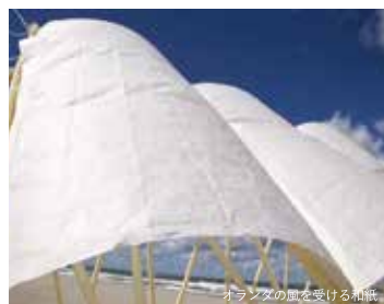
オランダの風を受ける和紙