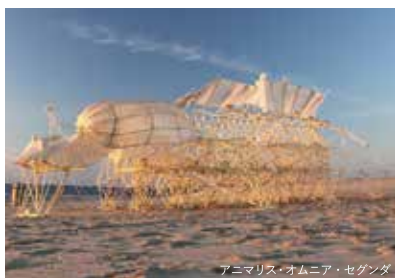
アニメリス・オムニア・セガンダ