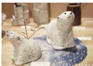
工芸セレクトショップ