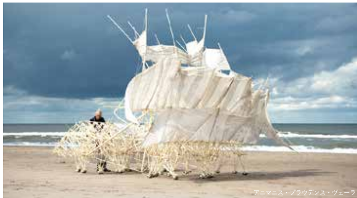
アニメニス・ブラウデニス・ヴェーラ

1948年、オランダ、スフェニンゲンに生まれる。デルフト工科大学にて物理学を専攻後、画家に転向。1986年から新聞のコラムを執筆し、その中の「砂浜の放浪者」をきっかけに「ストランドビースト」を考え出す。「現代のレオナルド・ダ・ヴィンチ」と称され、芸術と科学の融合した作品を発信し続けている。