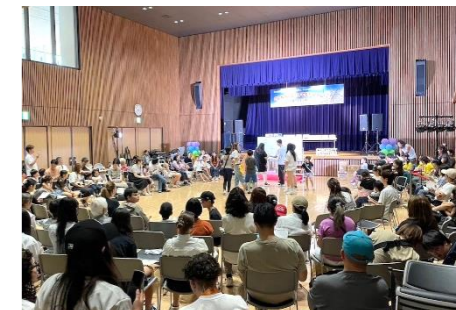
【親子交流イベント(イメージ)】

民間団体の地域子育てサポート活動を応援（1団体あたり最大50万円） 福祉と教育の連携強化に向けた「こども応援円卓会議」の開催