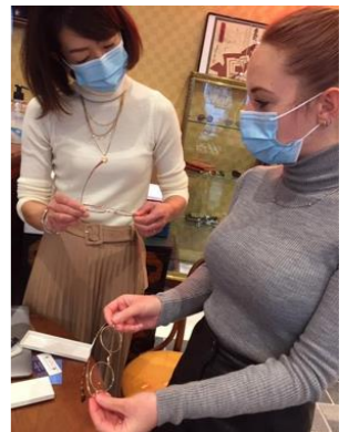
【外国企業との商談(イメージ)】