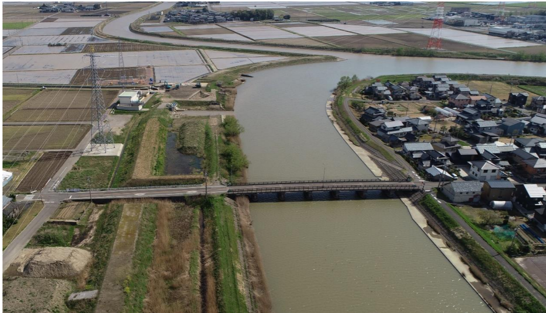
【河川改修 竹田川(あわら市)】103百万円

道路・河川・砂防ダム・港湾の整備 等 ほ場の整備、漁港・治山・農業用施設の整備 等