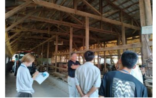
【畜産ジョブツアー】

ふくい畜産ジョブツアーの開催 畜産カレッジ開校に向けた準備 就農準備資金および経営開始資金の給付(制度創設)