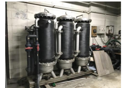
【高性能ボイラ(イメージ)】