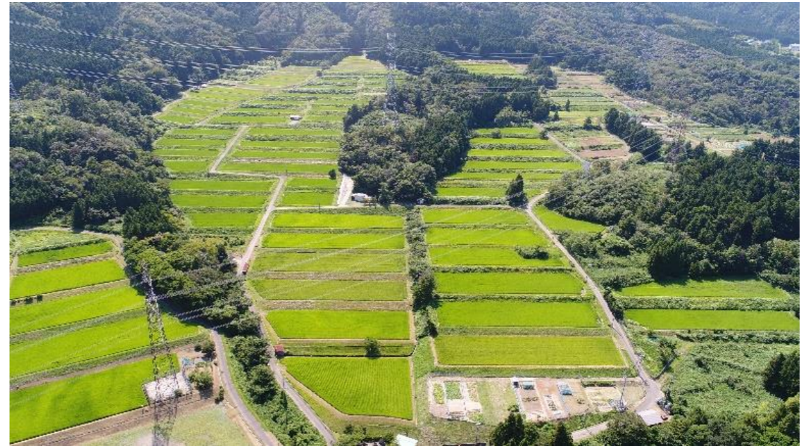
【ほ場整備 美浜新庄地区(美浜町)】154百万円