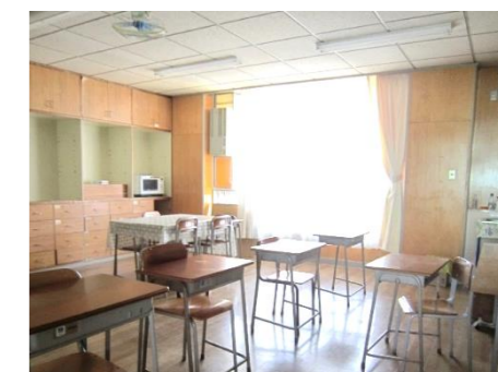
【校内サポートルーム】