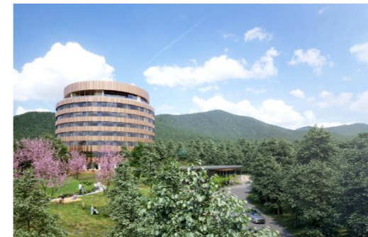
【ホテルイメージ(参考:リゾナーレ福井)】