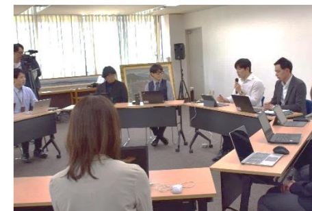
【若者躍動プロジェクトチーム会議】