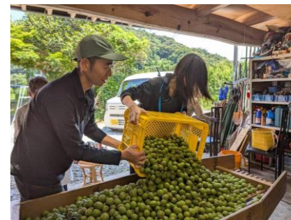
【地域活動の担い手（イメージ）】

有識者を講師に迎え、県内自治体・関係者向け研修会を開催 モデルとなるプロジェクトを4市町で実施