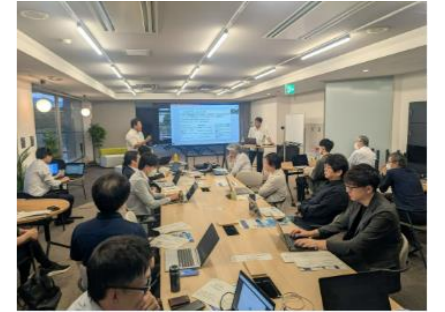
【AX意見交換会(イメージ)】

経営層によるAXコンソーシアム(AI研究の場)の創設 AXに関する講演会、研究会、意見交換会の開催 県内企業とAIスタートアップ企業のマッチングによるAX実証実験