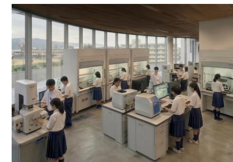
【高度分析・実験室(イメージ)】