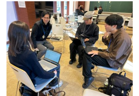
【伴走支援(イメージ)】

ビジネスプランコンテストを開催し、優秀なモデルに奨励金を支給 [奨励金] 200万円~1,000万円 成長期の事業拡大に意欲的な企業を、資金とノウハウの両面から支援 [補助率] 1/2 [補助上限額]1,000万円 創業を目指す起業家を発掘し、創業前後の伴走支援を実施