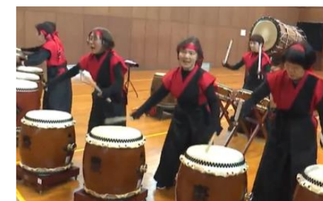
【高齢者のグループ活動(イメージ)】

高齢者の生活支援に対するニーズ調査の実施 買い物に対する生活支援サービス（買物代行、送迎、移動販売等）の実証 シニアグループ等の活動を多様なメディアにより発信