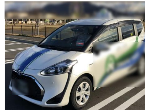
【省エネタクシー車両(HV、EV、PHEV、FCV)】

タクシーのLPガス車両から省エネ性能の高い車両(HV、EV、PHEV、FCV)への入替えを支援(LPガススタンド廃止の影響を受ける地域)