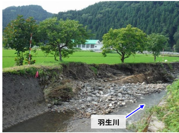
【羽生川(福井市大宮町 等)】 ブロック積護岸等による復旧