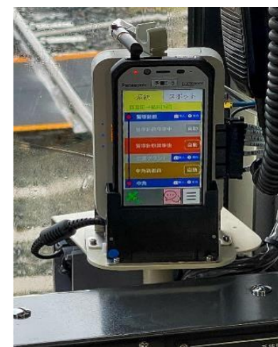
【運転士支援システム】

運転士支援システム:令和5~6年度に整備 総事業費:5,600万円 補助率:2/3