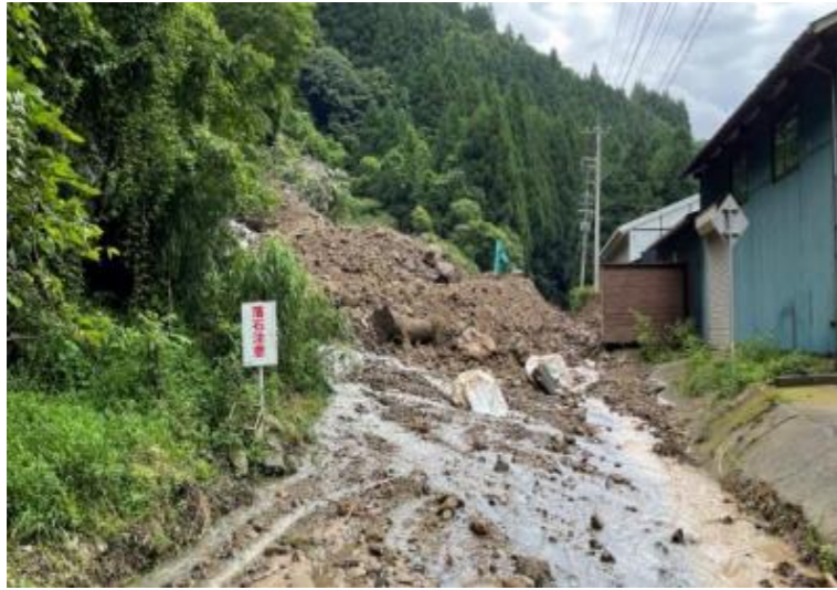
【福井四ヶ浦線(福井市国山町)】 重力式擁壁による復旧