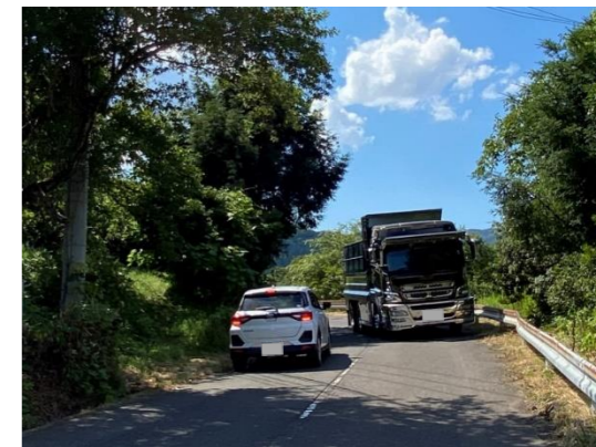
【急カーブの解消、道路の拡幅(高浜町山中)】

災害時の円滑な避難のための避難経路の改良・安全対策 (急カーブの解消、道路の拡幅、落石防止対策)