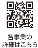
各事業の詳細はこちら

★初めて男性従業員が育児時短勤務を3か月以上実施 する場合は、別途40万円を支給します!!(1社1回限り)