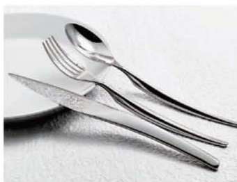
最優秀賞を受賞した 侑龍泉刃物の製品