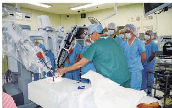
医療現場のニーズを探る見学会を開催

こうした高度なものづくり技術を先端産業に活かそうと、県では、他県に先駆けて、行政や大学が緊密に連携。中心となる企業を決めて事業化まで着実につながる「福井方式」と呼ばれる産学官連携を推進し、医療機器や炭素繊維の開発を行ってきました。