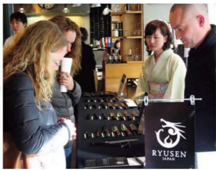
海外でも積極的に販路を開拓