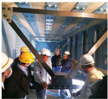
橋梁の補強部材の試験施工・実証試験を実施

繊維産業の歴史は古く、福井は奈良時代に全国有数の絹織物産地として栄え、現在も、主力のポリエステル長繊維織物では、出荷額が全国の約3割を占め、国内最大級の産地となっています。