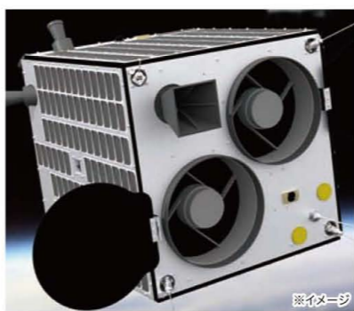
超小型人工衛星

機構の主要プロジェクトの一つに「県民衛星プロジェクト」があります。国の宇宙基本計画では、今後、宇宙産業の民生分野の拡