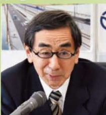
福井県知事 西川 一誠

「県民衛星プロジェクト」は、オープンイノベーション推進機構の主要プロジェクトの一つです。宇宙産業の市場は拡大しており、県内企業にとっても、先進的なビジネス展開が期待できる有望な分野になっています。