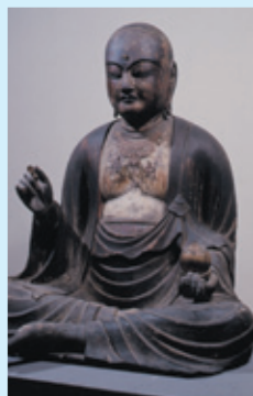
地藏菩薩坐像(瑞伝寺)