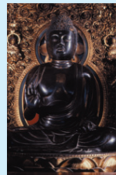
阿彌陀如来坐像(極楽寺)

9月17日(土)～11月30日(水)の土日祝(原則) 所小浜市、若狭町、おおい町、高浜町の寺院 詳若狭地域は、奈良・平安時代の仏像や中世の寺院建造物が集積する「文化財の宝庫」。普段は公開されていない貴重な仏像・仏画等を期間限定で特別公開します。 料各寺院での拝観料等 他対象となる寺院や公開日等 詳細は 若狭の秘仏 検索 関文化振興課 ☎0776-20-0572