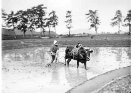
井田家旧蔵古写真

若狭地域の暮らしや風習を写した古写真を中心に、その古写真に写る実物資料を展示します。近現代の若狭地域の生活や文化をより深く知ることができます。