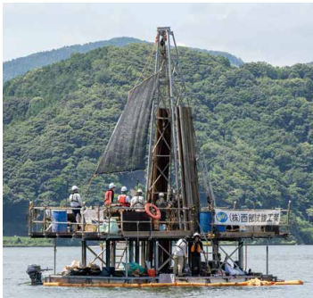
年縞掘削のようす(2025年・水月湖)

料 一般500円、 小中高生200円、 未就学児無料 他 若狭三方縄文博物館でも 関連展示を実施