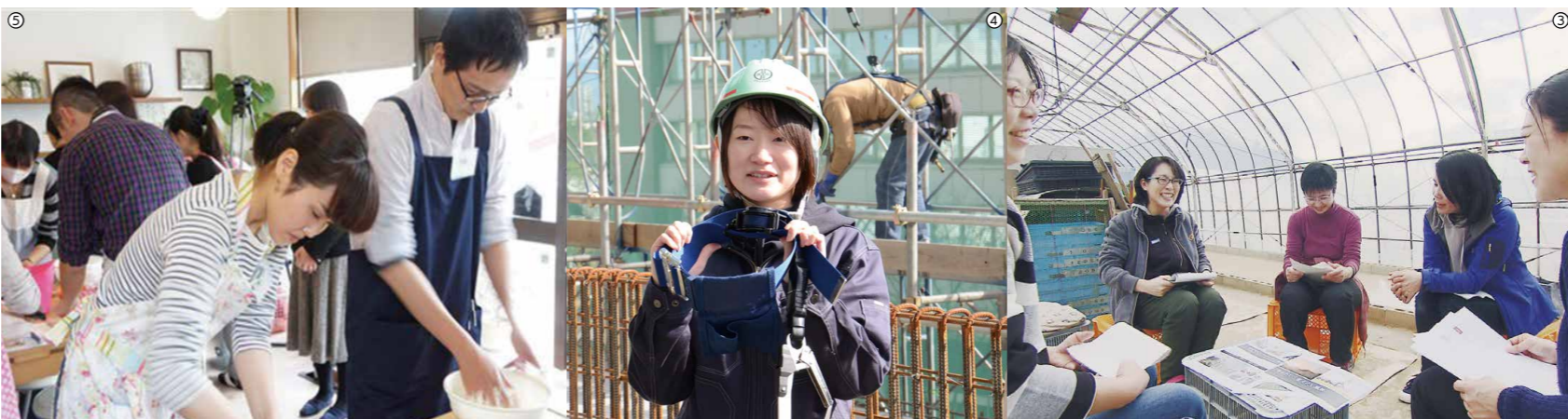
③イベントの企画や情報発信で農業に従事する女性をサポートする「福井女性ネットNEXT6」 ④女性が使いやすい軽量の安全器具導入などに取り組む「OKUTAKE女性活躍チーム」(奥武建設工業㈱) ⑤夫婦で分担しやすい料理を学ぶ「メンズ料理クラブ部」