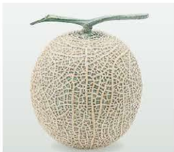
※写真はアールスメロン

坂井北部丘陵地や三里浜砂丘地、勝山市、鯖江市など県内各地で栽培されている。食後のデザート、贈答用にも人気が高い。