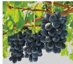
※写真はブラックビート

県内各地で栽培されている種無しぶどう。みずみずしい味わいと、色とりどりの鮮やかな見た目が特徴。“福井県産・糖度17度以上・種無し”などの条件をクリアした大粒のぶどうは「ふくぶる」と呼ばれる。