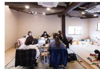
託児所を備えるオフィス(イメージ)

県の政策推進に寄与する高付加価値創出企業やサテライトオフィスを誘致するほか、若者や女性が働きたくなる環境づくりに取り組む企業を応援します。また、県名古屋事務所を設け、中京圏の企業誘致、Uターンをさらに進めていきます。