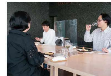
飲食店での食事の様子

事業者の事業継続を支援する給付制度を創設(県版持続化給付金)するほか、県内をお得に旅行できるキャンペーンやプレミアム付き食事券を発行し、飲食店などを応援します。