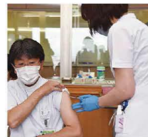
ワクチン接種の様子

ワクチン接種に必要な体制を整備するほか、保健所が積極的疫学調査などに注力できるよう、一元的相談窓口の体制を強化します。また、コロナ患者を受け入れるための病床確保の支援や県の要請に応じ、休業した事業者への協力金を拡充します。