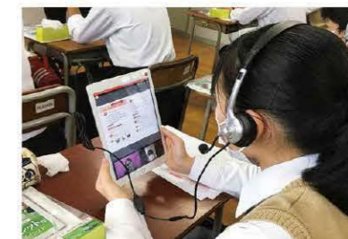
タブレット端末を活用した授業の様子

福井県DX(デジタルトランスフォーメーション)を進めるため、IoT、AI、5Gなどデジタル技術を導入する企業を応援します。また、効率的な避難所運営や県立学校の授業におけるデジタル技術の活用を進めます。