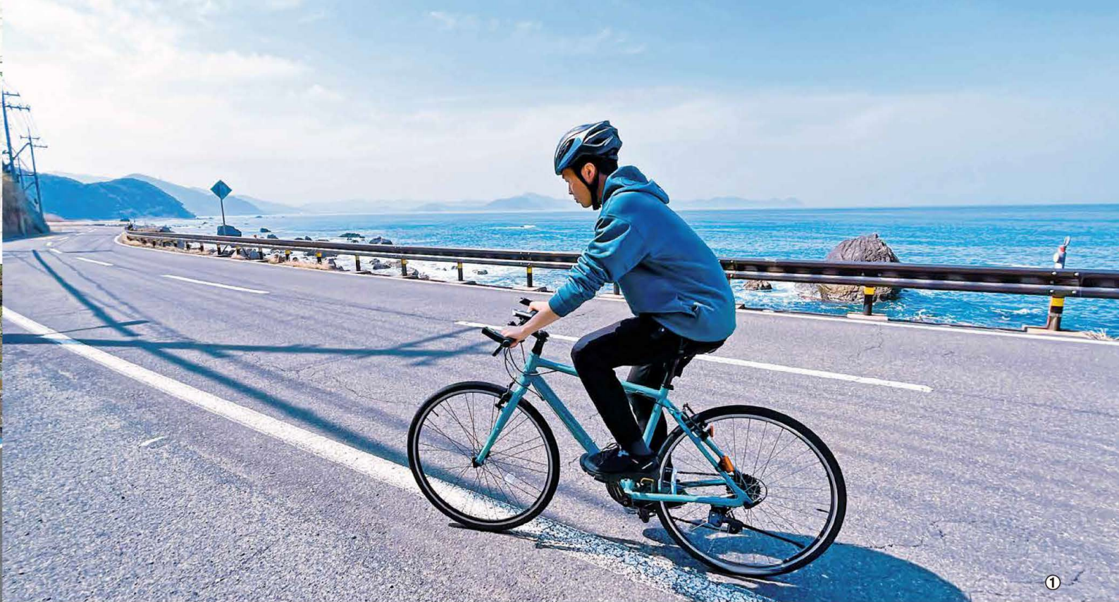
①若狭湾に臨む県道33号佐田竹波敦賀線 ②若狭湾サイクリングルート ③矢羽型路面標示が設置された道路を走行する様子