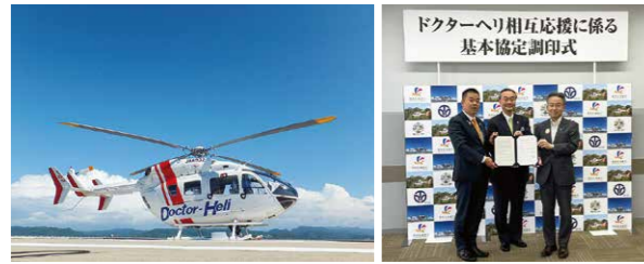
ドクターヘリ相互応援に係る 基本協定調印式

運航開始から1年間で出動回数は400回。今年5月には関西広域連合と協定を締結し、滋賀県と福井県で相互に応援運航を行っています。