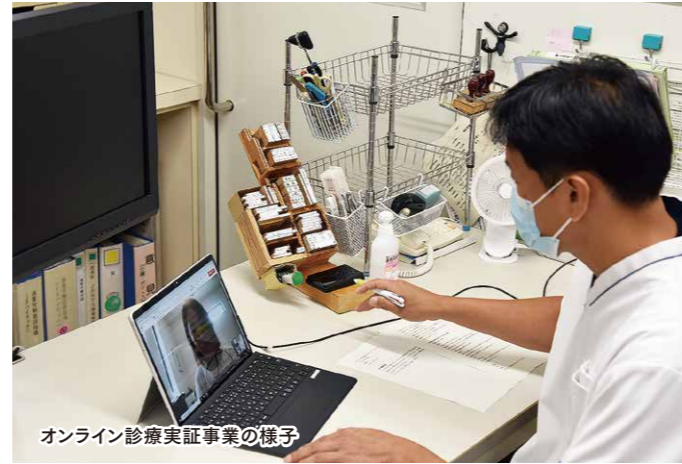
オンライン診療実証事業の様子