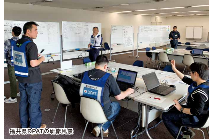
福井県DPATの研修風景