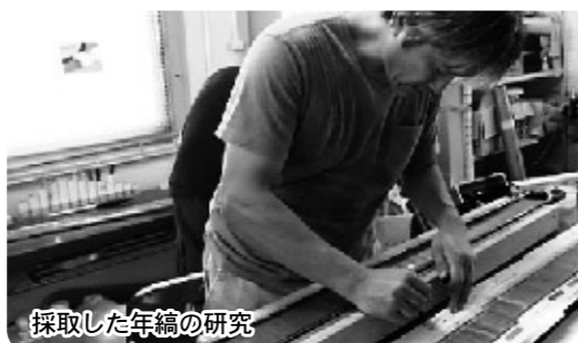
採取した年縞の研究

年縞による年代測定の精度をさらに高めるため、今年、立命館大学と共同研究の協定を締結します。