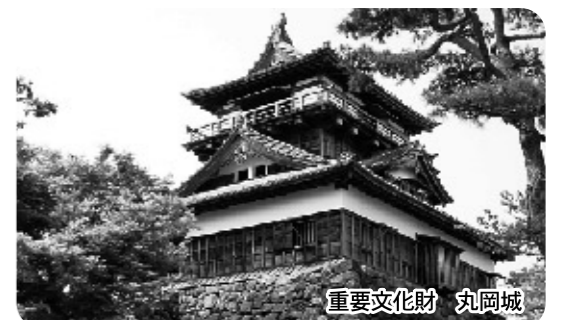
重要文化財 丸岡城

丸岡城は、国内最古とされる建築様式を持つ重要文化財です。今後、事業主体である坂井市と協力して、専門家による年代測定や建築工法などの調査を行い、国宝指定を目指します。