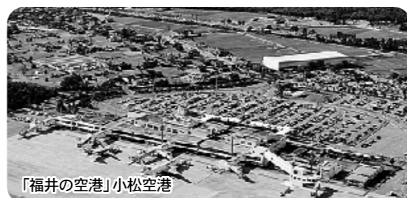
「福井の空港」小松空港

小松空港を「福井の空港」と位置づけ、動く恐竜ロボットを設置したり、アンテナショップ「福井のみやげ」をオープンしてきました。