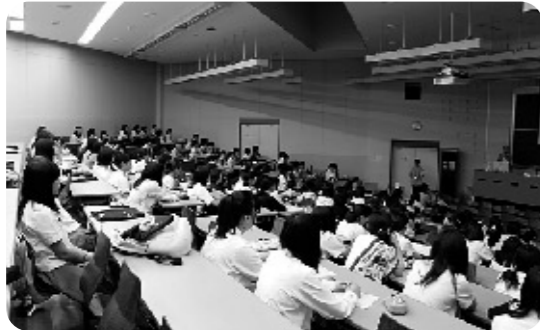
オープンキャンパスで県内大学の魅力を伝える