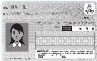
マイナンバーカード(みほん)

マイナンバーの提示と本人確認ができる身分証として使える「マイナンバーカード」。持っている皆さんの暮らしがより便利になります。皆さんのもとの郵送されている「交付申請書」にて申請が可能です。初回の発行手数料は無料です。