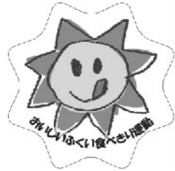
食べきり運動キャラクター「のっこさん」