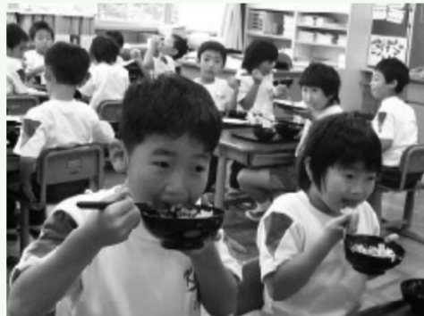
越前漆器を活かした学校給食

③栄養バランスのよい食生活を通じた 健康づくり を推進します! ・飲食店や社員食堂での、豊富な食材を活かした「ふくい健康美食」の提供を推進 ・「越のルビーをもう1個運動」など食育や地産地消を組み合わせた県民運動の展開