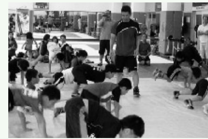
スーパーアドバイザーから指導を受けるチームふくいのレスリング選手

また、福井国体での有望選手約1200名を「チームふくい」に指定。オリンピック選手を育てた国内トップレベルの指導者たちが実践指導にあたっています。冬季には、降雪のない地域に出向き、強豪チームと実戦練習を行うなど、さらに戦力を強化!