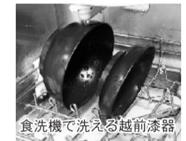
食洗機で洗える越前漆器

日時/2月18日(水)13:00~15:30 場所/小浜商工会議所 対象/新製品開発や、県産品の活用を図りたい方など