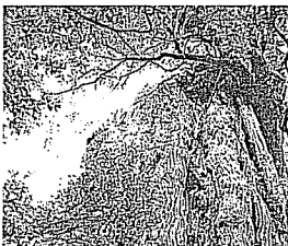
樹齢3千年といわれる屋久島の紀元杉

日程/① 12月2日(日)~4日(火) ※4日の復路で福井空港着 ② 12月5日(水)~7日(金) ※5日の往路で福井空港発 ◎ ①②とも1人128,000円(2泊3日) ◎ 県総合交通課 0776 (20) 0291