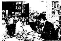
Uターン情報センターが福井県内での就職をサポート

企業から求人情報を収集し、Uターン就職を考えている方の条件にマッチした企業をご紹介します。