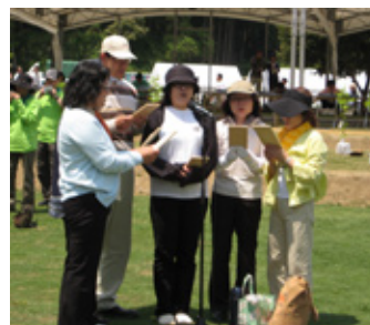
未来への一筆啓上