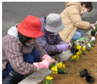
地域の皆さんによる花の植栽