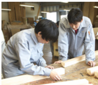
高校生による植樹用具製作