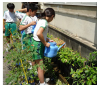
小学生が植樹用の苗木を育てます