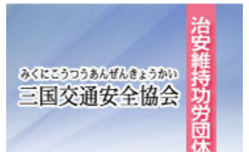
みくにこうつうあんぜんきょうかい 三国交通安全協会