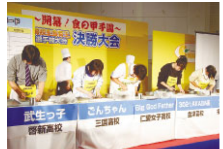
昨年の福井県大会。 今年は全国各地の高校生が参加

全国でブロック予選を勝ち抜いた各地の高校生たちが、食に関するクイズや調理の実演など、食の知識と技を競います。(ゲスト:彦摩呂)