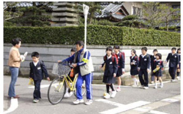
子どもたちに声をかけ ふれあいも生まれる

子どもたちの安全・安心を守っていくことは、大人の責務です。県民の皆さんの積極的なご参加をお願いします。