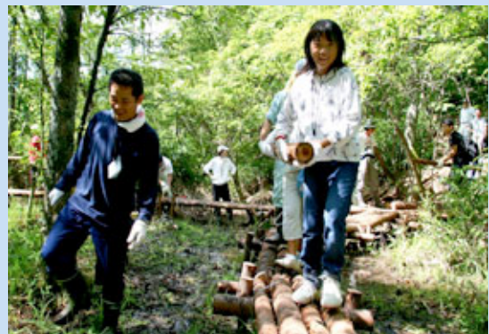
自然の中で伸び伸びと

センター主催の行事のほか、子供会など団体でご利用の方々を対象にスノーケリングや磯釣りなど、さまざまな自然体験メニューを用意しています。