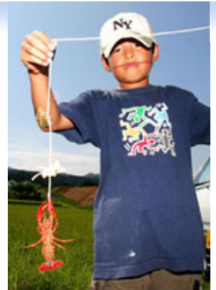
大物を釣り上げたぞ！

もうすぐ夏休み。海や山、川などへ出かけて、自然や生き物に触れ、元気一杯遊んでみませんか。