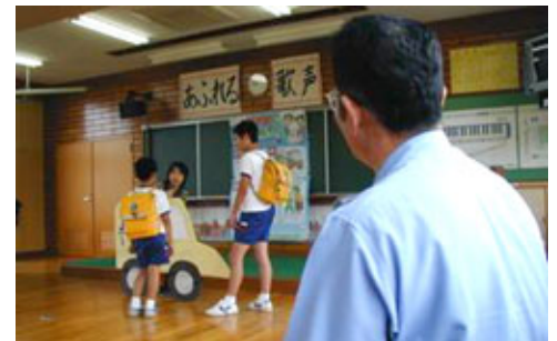
「声かけ事案対応訓練」の様子

小学校への防犯ビデオの設置やメール連絡システムの整備、登下校時の非常連絡機器の配備など、市町や自治会、PTAなどの地域の実情に応じた活動を支援しています。