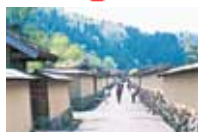
一乗谷朝倉氏遺跡

城下町を行きかう人、僧たちの厳しい修行、竹林にそよぐ風、城中でのくらしぶり。想像するといろんな「音」が聞こえてきそうな、叙情豊かなコースです。