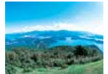
三方五湖・レインボーライン

青い海と白砂青松が織りなす彩。パノラマに広がった眺望と四季折々に、不思議な変化をみせる五色の水面。こんな風景を、縄文人も見ていたのでしょうか。自然の美に感動し、時の流れに思いをはせるコースです。