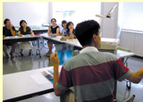
前期オープンカレッジの受講風景

FPU=福井県立大学(Fukui Prefectural University)