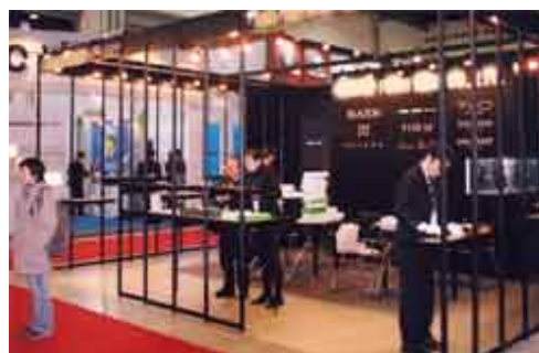
今年2月に上海で開催された眼鏡展示会には、県の支援制度を活用し5社が出展

展示商談会は市場を開拓する上で最も重要な場であることから、これまで行ってきた業界団体への出展支援に加えて、個別企業やグループが自ら企画して開催する個別の展示商談活動も積極的に支援します。