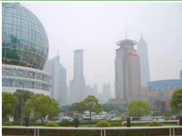
急速な経済成長を遂げる中国沿岸部の都市 上海