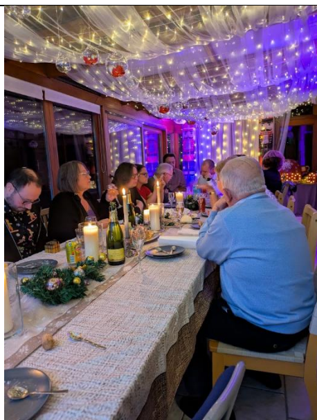
クリスマスの日に家族とその親戚が集まってパーティーをしたとき