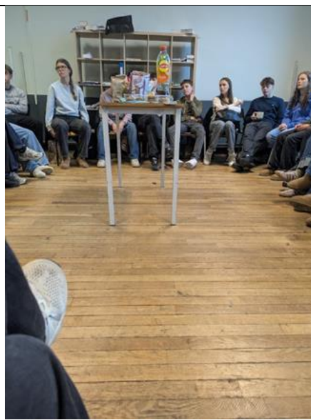
学校でクリスマスパーティーをしたとき