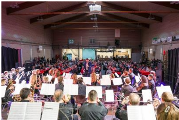
初めてコンサートに行ったとき