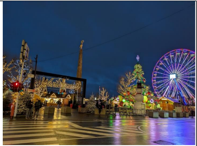
ホストファミリーとルクセンブルクのクリスマスマーケットに行ったとき