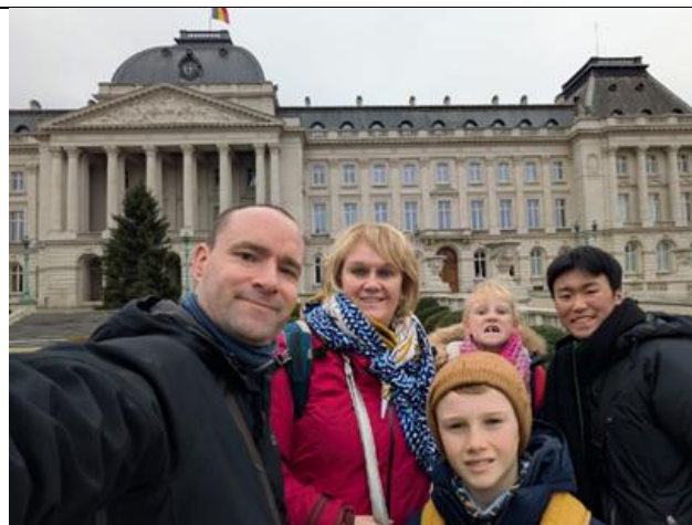
初めてブリュッセルに行ったとき