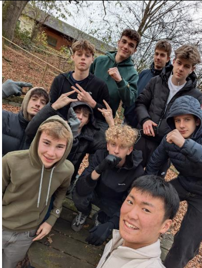
合宿の最終日にクラスメイトと撮ったとき