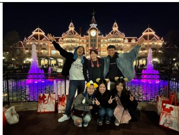
WEP のイベントで日本人の友達とディズニーランドに行ったとき