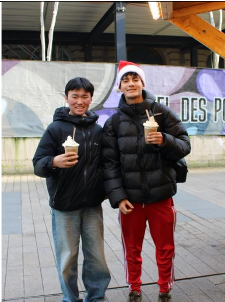
友達とルクセンブルクに行ったとき