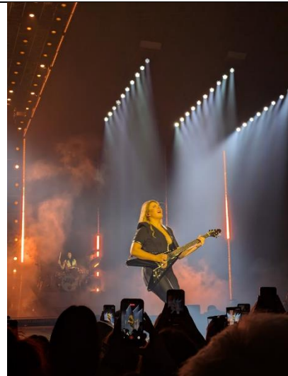
ホストファミリーと SANTA のライブに行ったとき