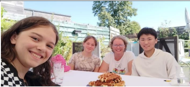
ホストファミリーの友達の家に行って、ワッフルを作った時