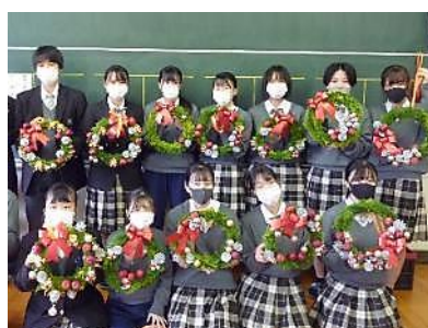
リース製作実習(流通コース)