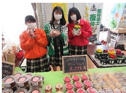
ふれあいマート外部販売実習