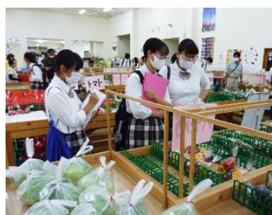
農産物直売所見学