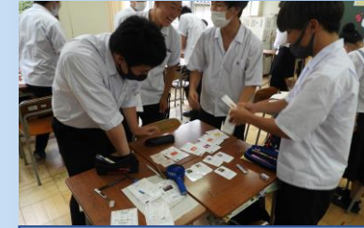
カードゲームでSDGsを学ぶ