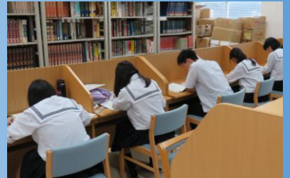
夜8:30まで自習できます