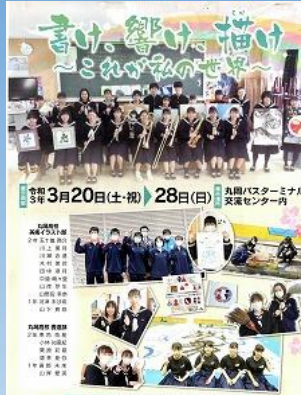
地域でのイベント 企画運営