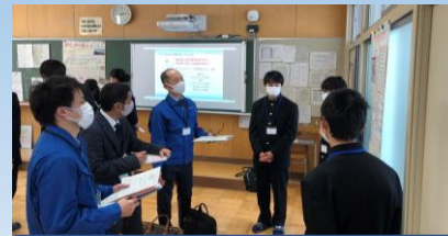
企業の方にプレゼン