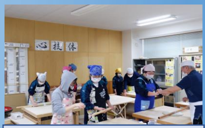
地域協働部 そばうち