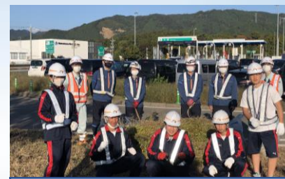
調査、ボランティア、発表