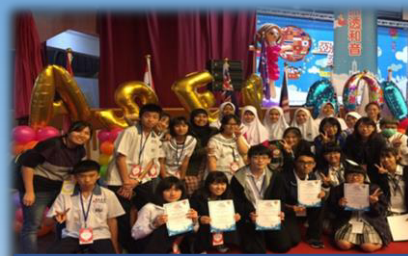
タイスタディツアー