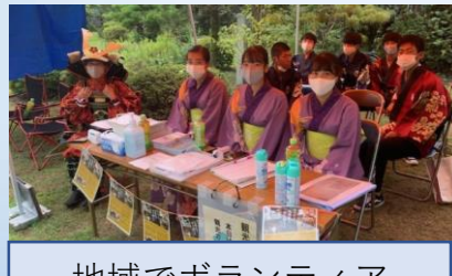
地域でボランティア