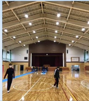
体育館は改装したて