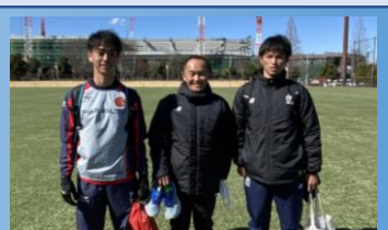
日本高校選抜、田海先輩、 飯田先輩と小阪監督