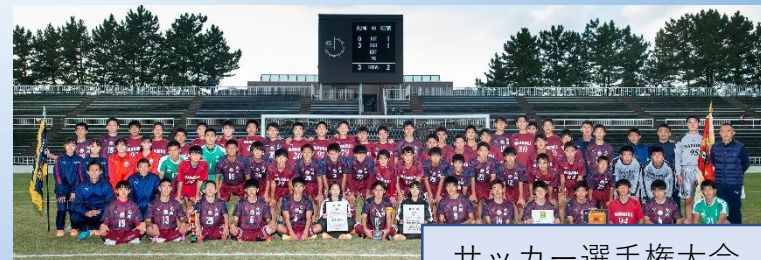
サッカー選手権大会