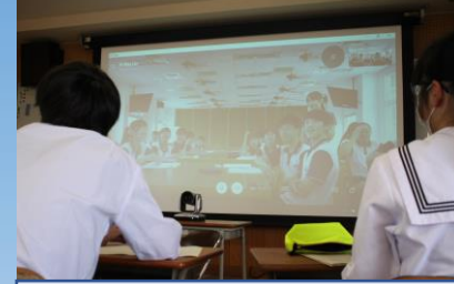
台湾の高校生と遠隔授業