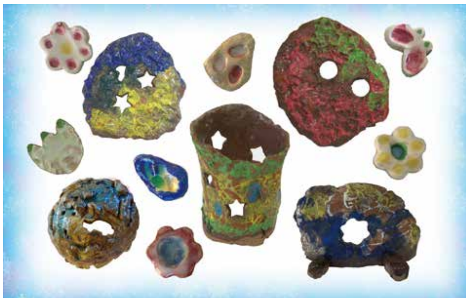
小学部高学年・高等部 陶芸作品