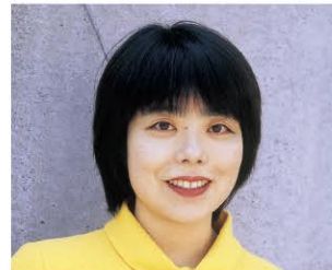
倭 万智氏 (1981年3月卒) (歌人)

大学で教育・研究に携わる者として高校生に期待するのは、大学入試をゴールにするのではなく、大学において学び考え、さらには社会のなかで自分らしく生き、社会をよりよいものとしていくための力の基礎になるものを獲得することです。藤島高校の伝統と教育における進取性は、自ら学び考え、自分らしく生き、よりよい社会を設計し創造する力を陶冶してくれるでしょう。また、なにかに打ち込んだ経験や深い人間的交流は、社会のなかで担うべき役割を自覚させ、弱い立場にあって苦しんでいる人のことを思い遣る力を育ててくれるでしょう。