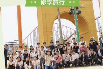
● 修学旅行 ●