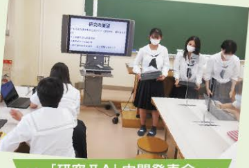
● 「研究ⅡA」中間発表会 ●