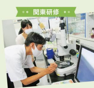
● 関東研修 ●