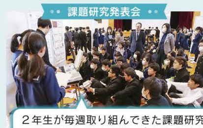
● 課題研究発表会 ●

2 年生が毎週取り組んできた課題研究について発表します (口頭・ポスター)。毎年、熱のこもった発表となっています！