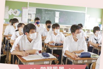
● 学習風景 ●

卒業生40名近くを講師に迎え、高校時代やお仕事についてのお話を伺い、職業・進路選択の参考にしています。