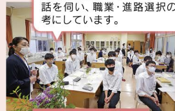
● ようこそ先輩 ●