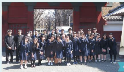
● 東大セミナーラボ ●

2 年生が毎週取り組んできた課題研究について発表します (口頭・ポスター)。毎年、熱のこもった発表となっています！