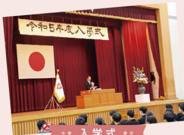
● 入学式 ●