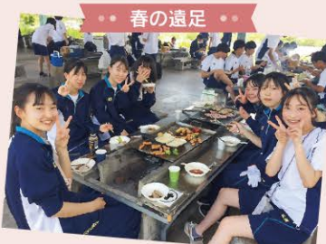
● 春の遠足 ●