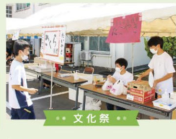
● 文化祭 ●

茨城県つくば市のJAXAや理化学研究所を訪問し、最先端研究について学びます (本校卒業生のお話も伺います)！