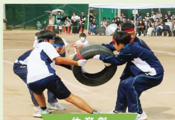
● 体育祭 ●