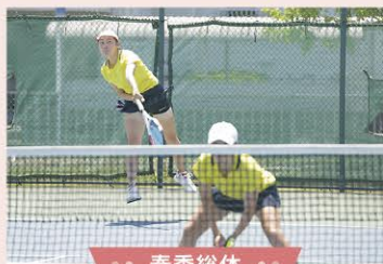
● 春季総体 ●