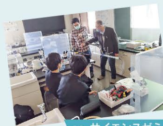
● サイエンスゼミ ●