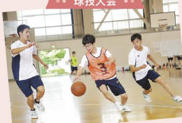
● 球技大会 ●