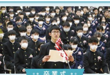
● 卒業式 ●