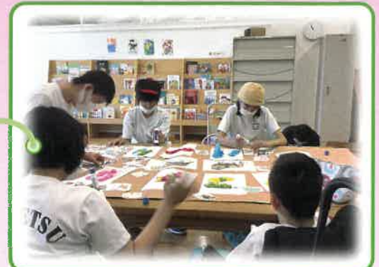
生活単元学習(秋まつりの準備)