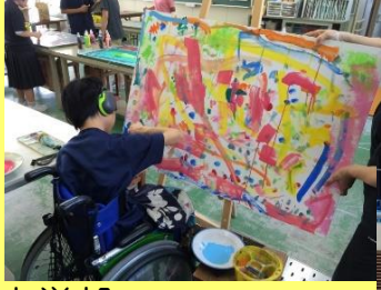
中学部 運動部・文化部

将来の生活にも役立つ体育的・文化的活動を 中学部・高等部生が放課後に行っています。