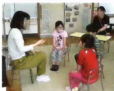
朝の話し合い活動