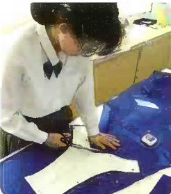
ファッション造形