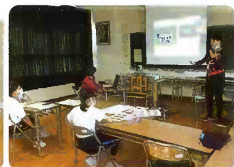
リモート交流(小学部)