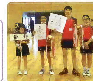
北陸地区ろう学校親善体育大会