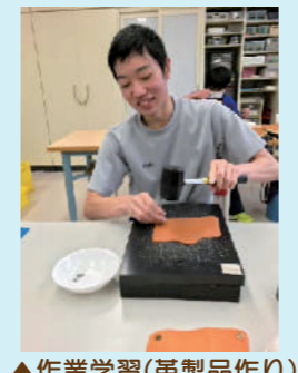
▲作業学習(革製品作り)