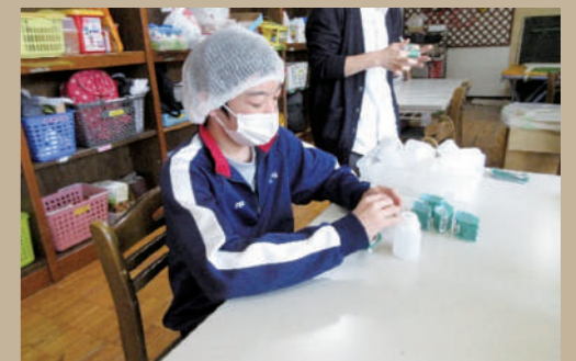
▲産業現場等における実習