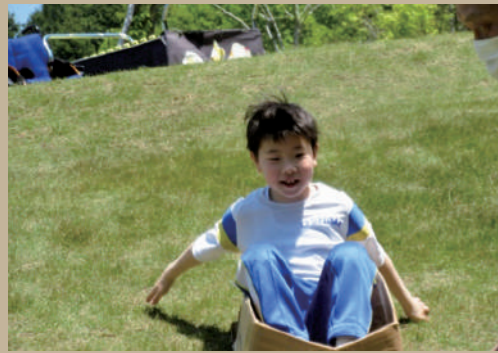
▲遊びの指導(芝そり)