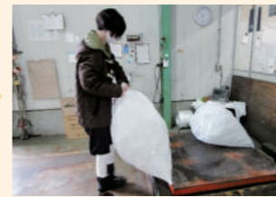
▲校外学習(リサイクル)