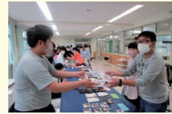
▲しみずっこのついで(販売)