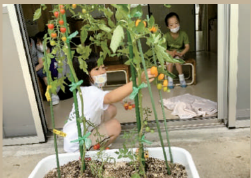
▲生活単元学習(野菜の収穫)