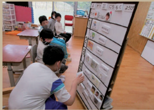
▲日常生活の指導(朝の会)