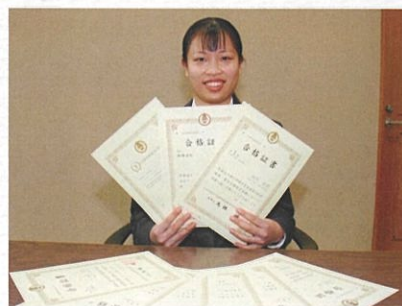
全商検定全科目 2年次最速合格生徒