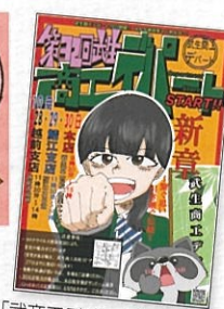
「武商工デパート」ポスター