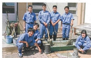
コンクリート実習