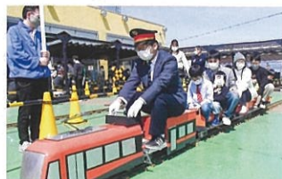
ミニ電車 (地域貢献)