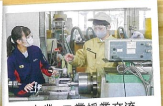
商業・工業授業交流