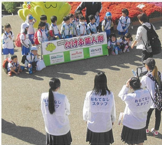
フィールドワーク

「マーケティング(商品売るための活動)」を柱に、地域の企業や人々の協力を得ながら、ビジネスとは何かを具体的に探究していきます。