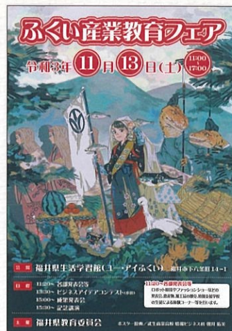
ふくい産業教育フェア 採用ポスター