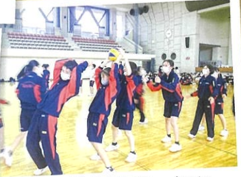
商業・工業合同レクリエーション