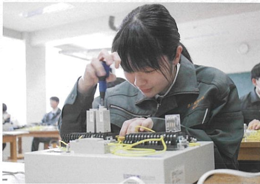
機械保全 (電気系保全作業)

産業や日常生活に欠かすことのできない電気・電子・情報の基礎を学びます。ものづくりや実験を体験しながら実践的な知識や技術を身につけます。