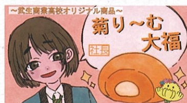
「武商工デパート」商品開発