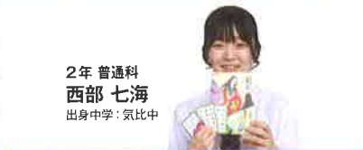
2年 普通科 西部 七海 出身中学：氣比中

柔道部では、「総体出場」を目標に部員全員で明るく日々の練習に励んでいます！学習面では、授業中に解けなかった問題もそのままにせず、休み時間や解説動画を活用して取り組んでいます！