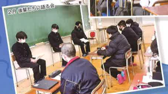
2月 後輩たちに語る会