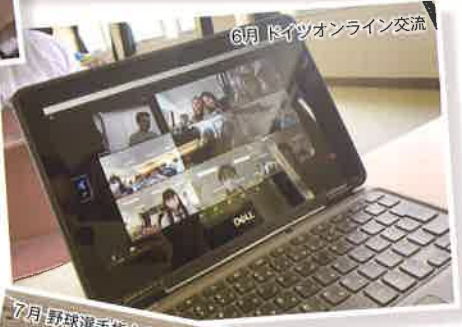
6月 ドイツオンライン交流