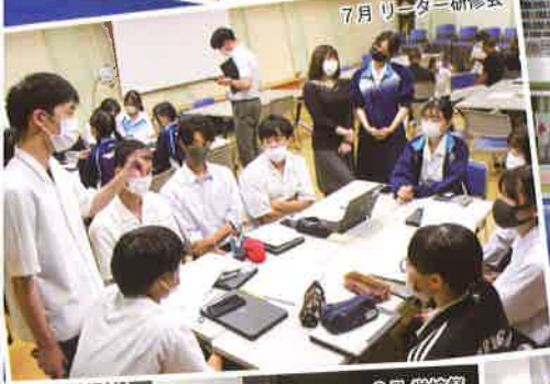
7月 リーダー研修会