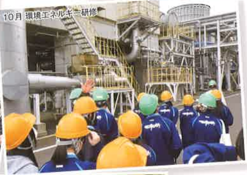
10月 環境エネルギー研修