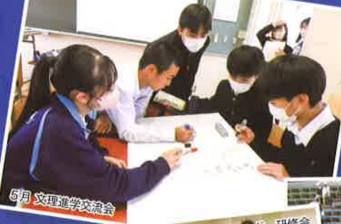
5月 文理進学交流会