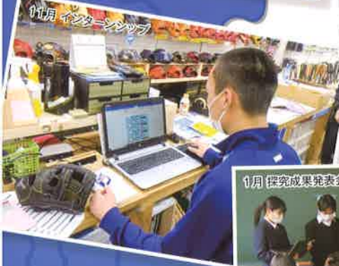
11月 インターンシップ