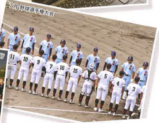
7月 野球選手権大会