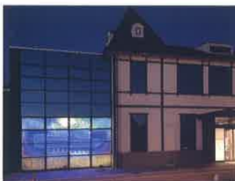
敦賀ムゼウムイルミネーション