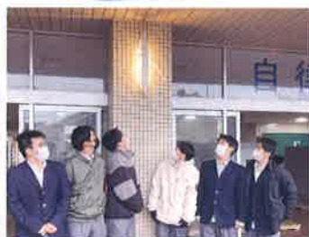
クリアランス金属を用いた 照明ブラケット