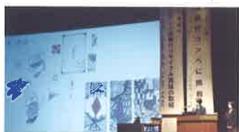
課題研究発表会 (1月)