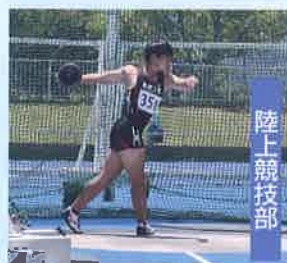
春季総体円盤投優勝