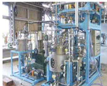
発酵アルコール精留装置