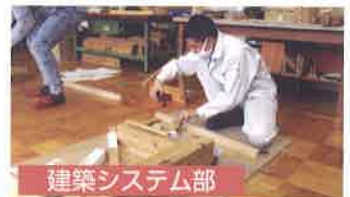
地域での工作教室開催