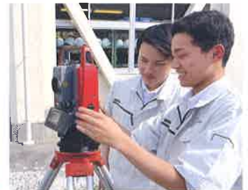
トータルステーション