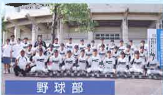
北信越地区高校野球大会出場 (77季ぶり5回目)