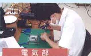
ものづくりコンテスト 電子回路組立部門 北信越大会優良賞