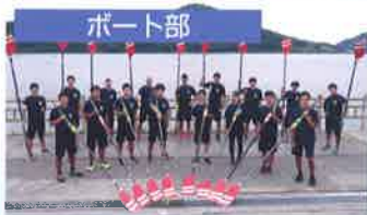
全国高校選抜優勝 アジアジュニア選手権優勝