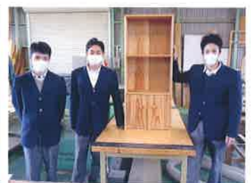
美浜東小学校 本棚寄贈