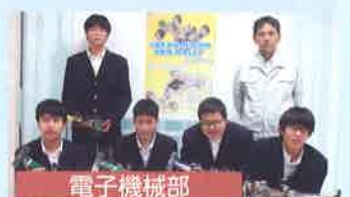
マイコンカーラリー全国大会出場