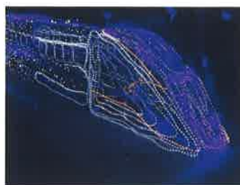
敦賀駅オルパークイルミネーション