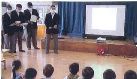
森林環境保全教室