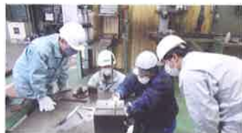
インターンシップ (10月)