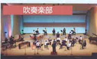
スプリングコンサート