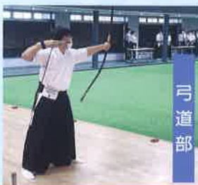
北信越新人大会出場