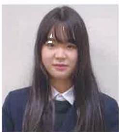
籠 柚 姫