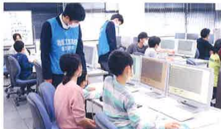
プログラミング教室