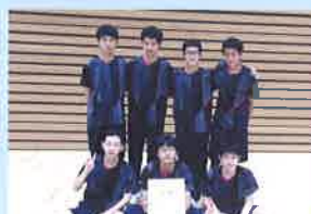
県民スポーツ祭 団体3位