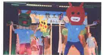
敦工祭 (文化祭) (9月)