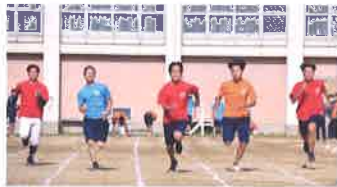
敦工祭 (体育祭) (9月)