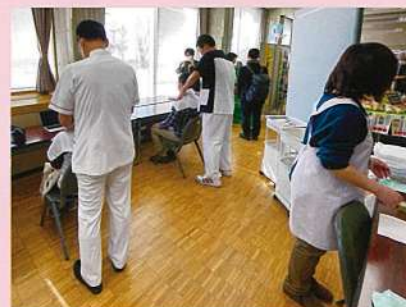
ふくい産業教育フェア