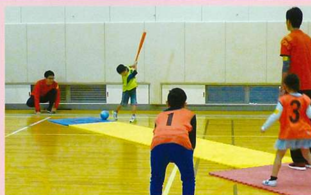
小集団での活動の様子