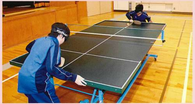
卓球部 (写真はサウンドテーブルテニス)