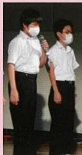
文化祭 (各学部の発表)