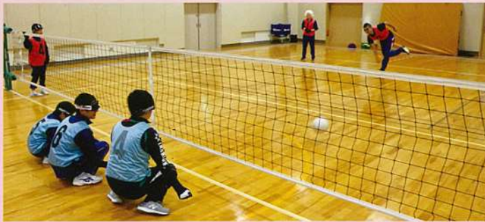
フロアバレーボール部