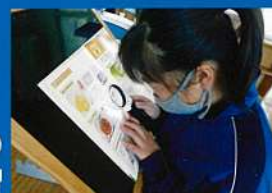
▶ルーペの使用練習