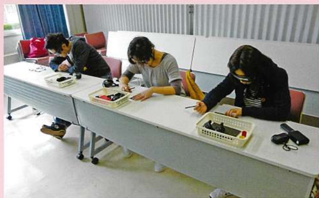
保護者対象の研修会