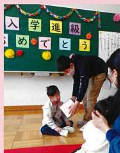
入学・進級お祝い会