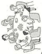
大声での会話や 飲食は控える