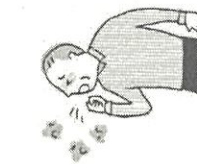
体調不良の場合は 面会を断る