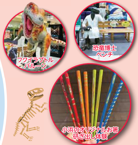
フライアトルパルーン

福井県内各地の魅力、観光情報が勢揃い! フライアトルパルーンや恐竜博士ベンチもあるよ!