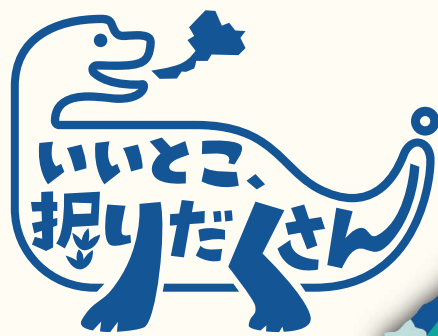
福井県新キャッチコピー・ロゴマーク