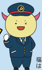
福井県 はびりゅう

〈主催〉福井県 〈問い合わせ〉福井県交流文化部誘客推進課 TEL: 0776-20-0762 (平日8:30~17:15)