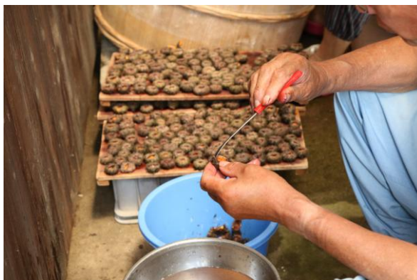
ウニの身を取り出す作業