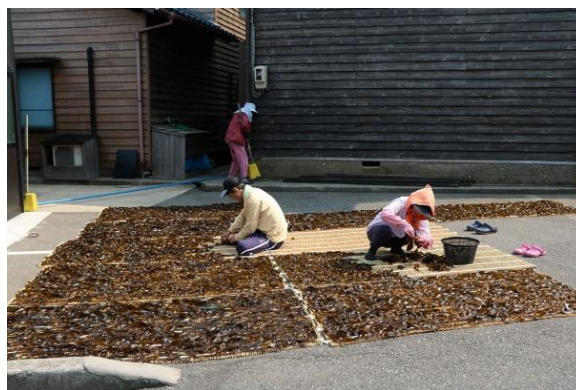
ワカメの加工（ワカメ干し）