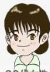
30代女性 中学校教諭

レベルの高い教育をしている福井県で先生をすると、教員のスキルもどんどん上がっていく感じがして、良い環境だなと思いながら働いています。