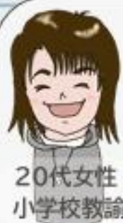
20代女性 小学校教諭

教えて先生！ふくい教育、ふくいの子どもたちって…？ 実際に福井で働く先生にインタビューしてみました！