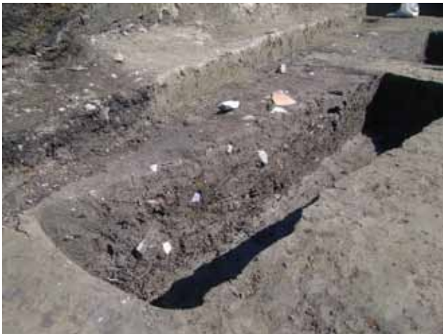
写真3 ゴミ穴の堆積状況