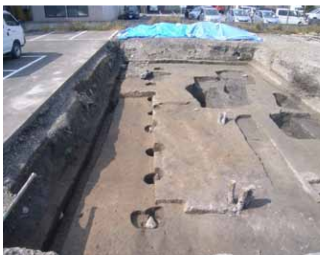
写真 2 柱穴が一行に並ぶ (東から)