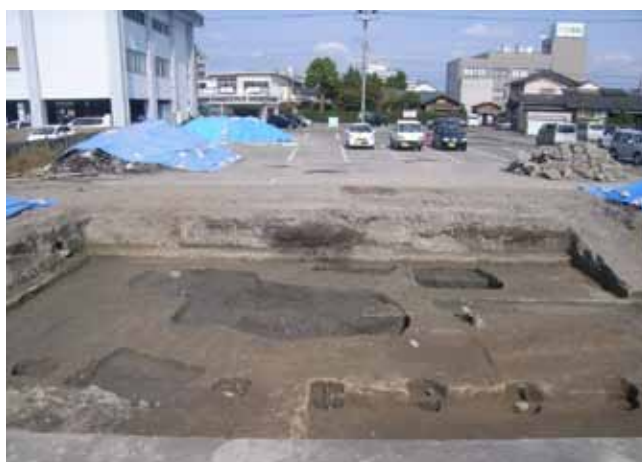
写真 1 調査地全景 (南から)